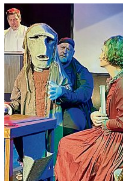
Die Gummersbacher Inszenierung findet am 4. Juli statt.